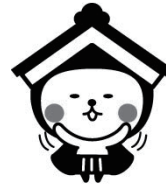
栃木市マスコットキャラクター とち介 (とちすけ)